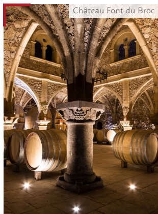
Château Font du Broc