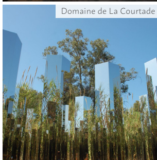
Domaine de La Courtade