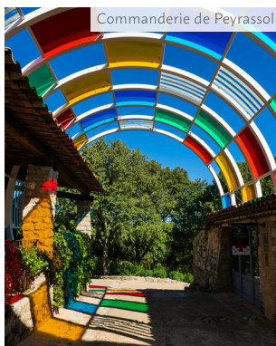
Commanderie de Peyrassol